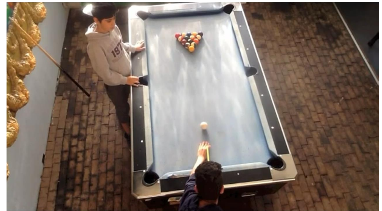
Unsere Heimat (1:26)